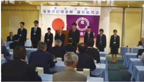
総代会にて新入職員の紹介