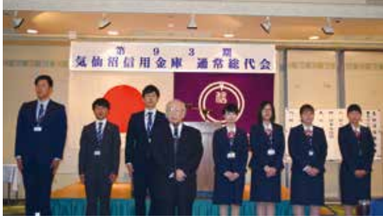
総代会にて新入職員の紹介