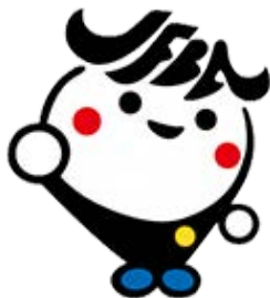
日弁連広報キャラクター シャブバ