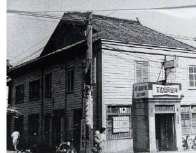
昭和 28 年 玉名信用金庫