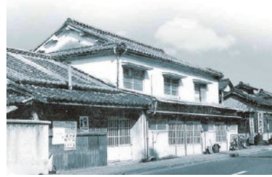
熊本中央信用金庫発祥の地 (水俣市陣内)