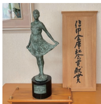
平成 11 年 第 2 回 信用金庫社会貢献賞 特別賞を受賞