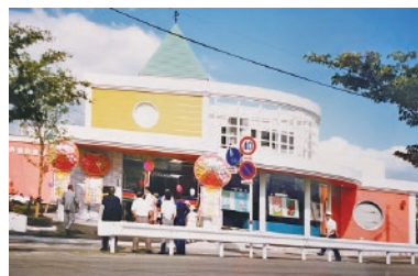
平成 3 年 松江支店開設（八代市）