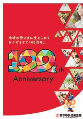
令和 5 年 創立 100 周年