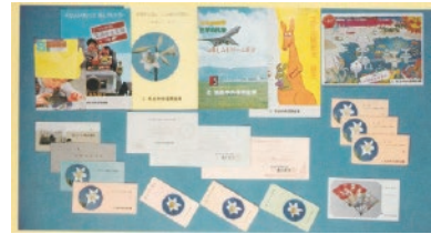
昭和 40 年代の通帳証書