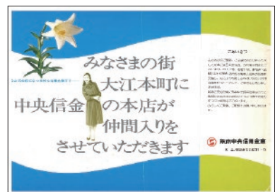
昭和 55 年 新本店オープンチラシ