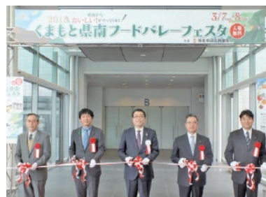
平成 27 年 くまもと県南フードバレーフェスタ