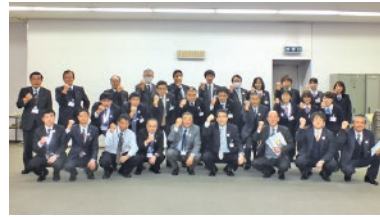
平成 25 年 創立 90 周年記念事業 全役職員で認知症サポーター養成講座受講