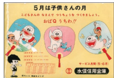
水俣信用金庫時代のチラシ