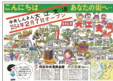
昭和 54 年 大江支店（翌年の新本店オープンまで）開設チラシ