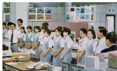
平成 4 年 水俣支店新築リニューアルオープン