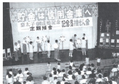
昭和 34 年頃「定期預金抽選会」