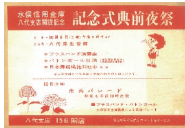
昭和 40 年 八代支店開設