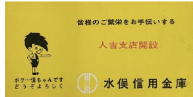
昭和 42 年 人吉支店開設