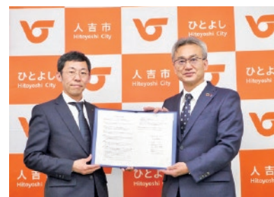
令和 3 年 よい仕事おこしフェア 実行委員会協定締結式