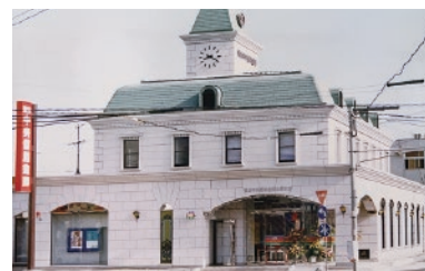
平成 4 年 水俣支店新築リニューアル