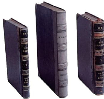
佐敷信用組合時代の台帳