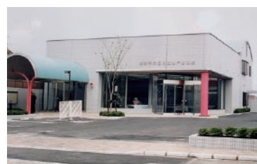
平成 8 年 戸島支店開設