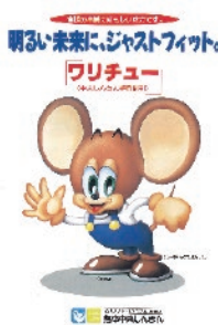
平成 5 年 チューちゃん登場