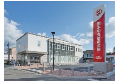
平成 25 年 八代支店新築リニューアル