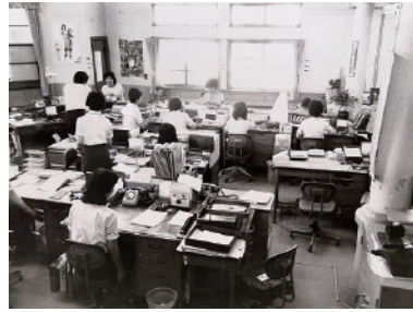
旧本店（水俣信用金庫）