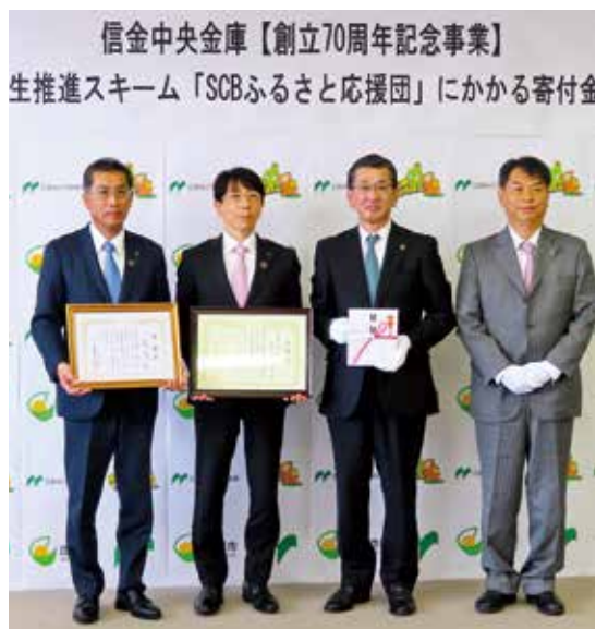
3月28日 SCBふるさと応援団寄付金贈呈式

○信金中央金庫の創立70周年記念事業「SCBふるさと応援団」に、庄原市の「キャッシュレスカード「な・み・か」「ほ・ろ・か」による地域経済循環事業」を推薦し、本事業が寄付対象事業として採択され、1,000万円が庄原市に寄付されました。「SCBふるさと応援団」は、地方創生に資する取り組み等に対し、信金中央金庫が企業版ふるさと納税を実施するというものです。当金庫では、地域の持続的な発展に向け、当該寄付事業に対する支援に継続して取り組んでまいります。