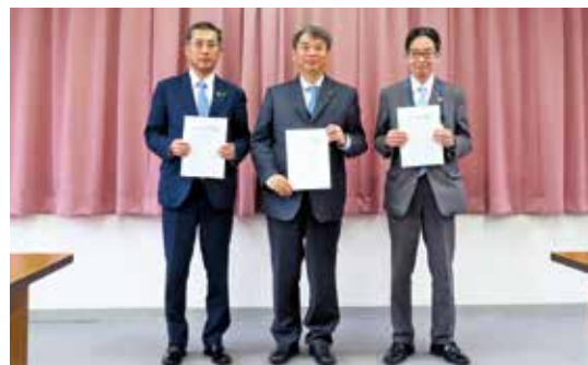
3月18日 庄原市キャッシュレス決済推進協議会との包括連携協定

○庄原市の商工・観光団体で構成する「庄原市キャッシュレス決済推進協議会」と包括連携協定を締結いたしました。キャッシュレス事業を通じて、庄原市における地域経済の活性化および住民サービスの向上の実現に取り組んでまいります。