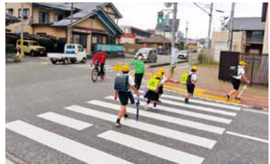
9月22日 秋の全国交通安全運動ボランティア活動