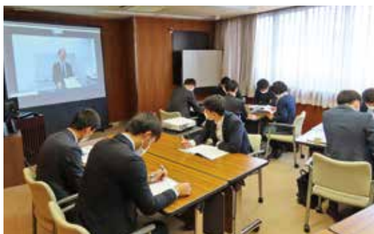
4月15日 渉外担当者研修