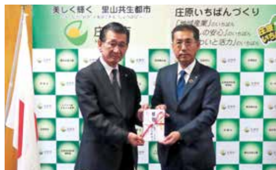
11月8日 庄原市役所贈呈式

○庄原商工会議所等と協働し、起業・創業に係るサポートプログラム「庄原創業塾」を開催いたしました。今後も行政や外部機関等と連携し、地域の創業や成長企業を目指す支援に取り組んでまいります。