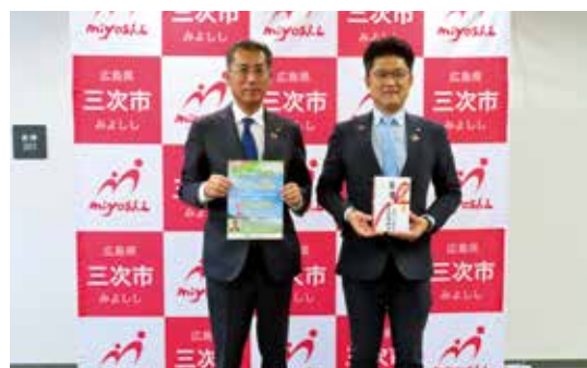
11月2日 三次市役所贈呈式

○新型コロナウイルス感染症対策に活用いただくことを目的に、庄原市、三次市の両市に対し、それぞれ50万円の寄付を行いました。当該寄付金は令和3年7月1日から9月17日まで取り扱いました「新理事長就任記念寄付金型定期預金“みどりの輝き”」の募集総額の0.10%相当額を寄付したものです。