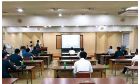
8月6日 SBC会員体験発表会