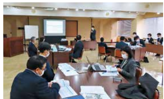
10月13日 企業資金繰りセミナー