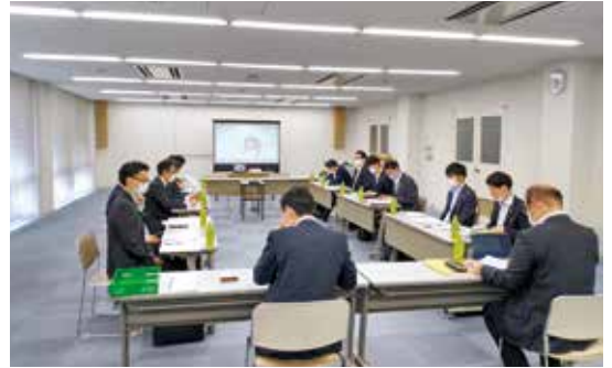
10月26日 広島県しんきん事業承継ネットワーク連絡会議