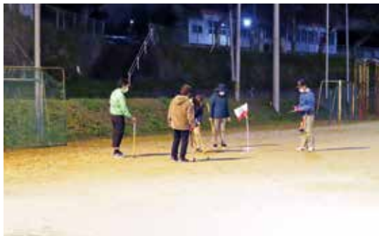
10月28日 第48回赤い羽根共同募金 チャリティーグラウンドゴルフ大会