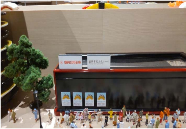
(写真：開場式の様子および作品の一部)