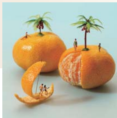
未完の船でもなんとかなるさ(2016年)