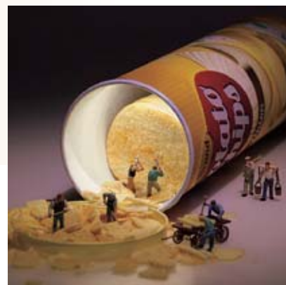
掘っても掘っても止まらない食欲(2017年)