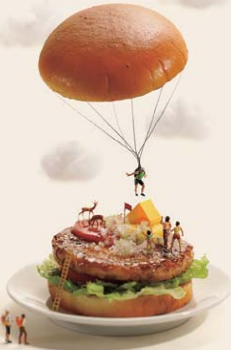
“パン”ラシュート(2017年)

本展では立体作品と写真作品約170点を展示します。遊び心たっぷりの田中達也の見立ての世界をご体感ください。