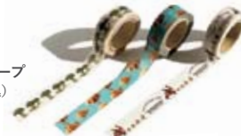
マスキングテープ 各473円(税込)