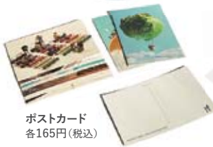
ポストカード 各165円(税込)

※画像は実際の商品とは異なる場合がございます。※数に限りがございます。売り切れの際はご了承ください。