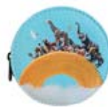
コインケース 1,760円(税込)