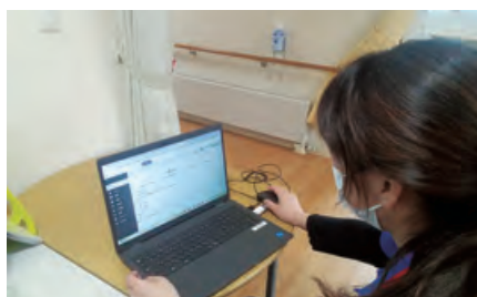
システム利用の様子