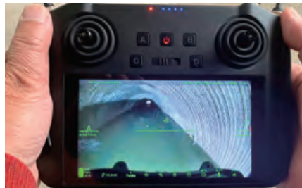
製品使用中のカメラ映像