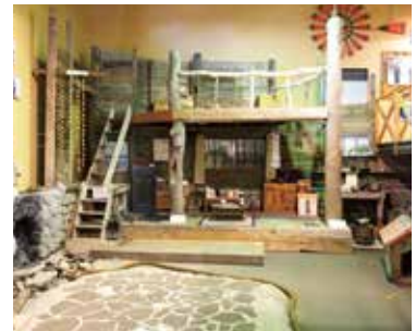
<北の国から 撮影セット>