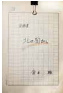
<北の国から 企画書>