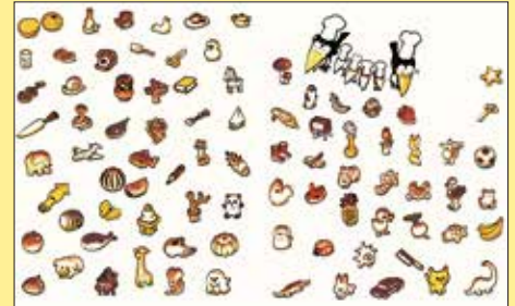
『からすのパンやさん』1973年 偕成社