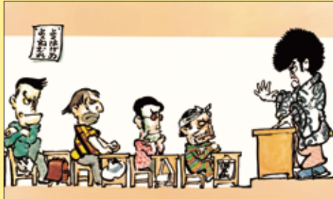
『どろぼうがっこう』1973年 偕成社