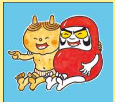
『だるまちゃんとかみなりちゃん』1968年 福音館書店