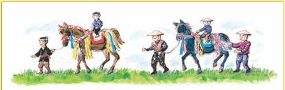
『こどもの行事 しぜんと生活 6月のまき』チャグチャグ馬コ 2012年 小峰書店