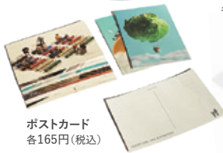
ポストカード 各165円(税込)

※画像は実際の商品とは異なる場合がございます。※数に限りがございます。売り切れの際はご了承ください。