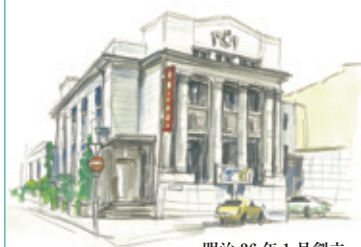
明治 36 年 1 月 創立