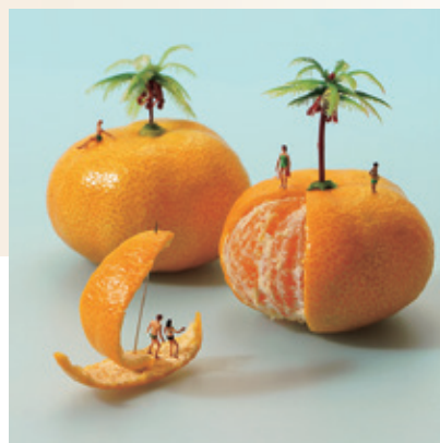
未完の船でもなんとかなるさ(2016年)