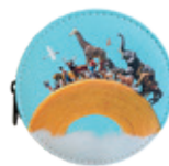
コインケース 1,760円(税込)