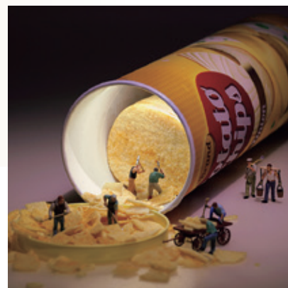
掘っても掘っても止まらない食欲(2017年)