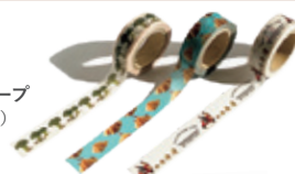
マスキングテープ 各473円(税込)