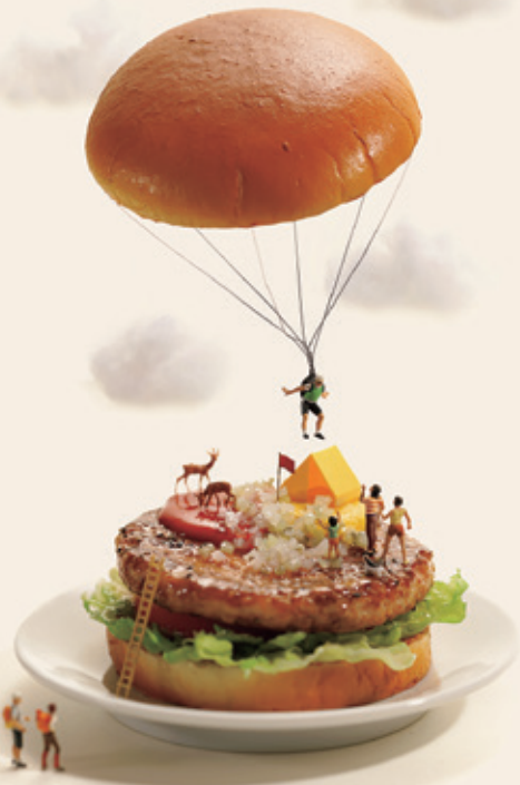
“パン”ラシュート(2017年)

本展では立体作品と写真作品約170点を展示します。遊び心たっぷりの田中達也の見立ての世界をご体感ください。