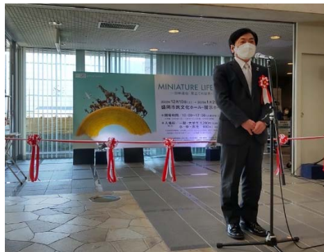
もりしん Presents「ミニチュア ライフ展2」

今後につきましても、サステナブルな未来に向かって、SDGs・ESGの更なる推進体制強化を図るべく、全役職員一丸となって取り組むとともに、自治体や企業の皆さまとパートナーを組み、地域金融機関としての役割を果たしてまいりますので、引き続き、ご支援・ご協力を賜りますようお願い申し上げます。