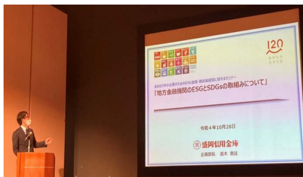
お客さま向け ESG 金融セミナー