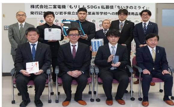
もりしん SDGs 私募債