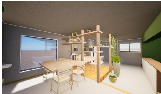
株式会社 NoMaDoS(ノマドス)にてデザイン監修