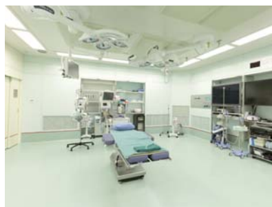
感染予防に細心の注意が必要な人工関節置換手術。西の京脊椎人工関節センターではNASA規格でクラス100という最高レベルの清浄度を保つ手術室で行われます。

こうして負担が軽減されたMIS法ですが、日本人の場合には手術そのものを敬遠する傾向があり、膝や股関節の手術を受ける方は欧米に比べると1/4ぐらいしかいないのが実情です。手術をすれば、通常の日常生活はもちろん、買い物にも旅行にも行けてもっと日常生活を楽しむことができるようになります。ですから最新の人工膝関