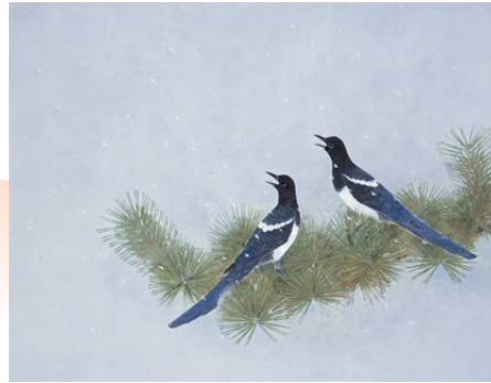
右3点/ 松伯美術館蔵