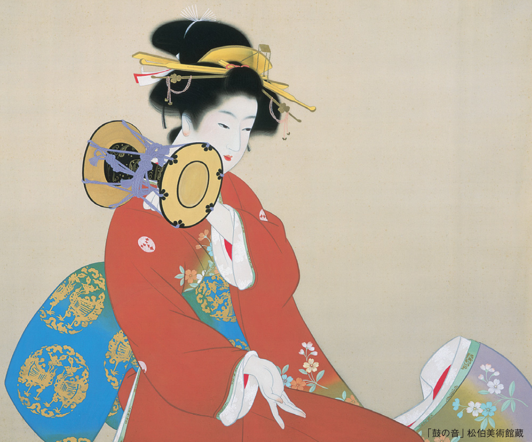
「鼓の音」松伯美術館蔵