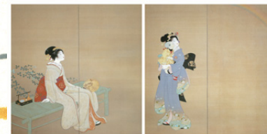
「虹を見る」京都国立近代美術館蔵

※10月12日(月)、11月23日(月)は開館、 10月13日(火)・11月24日(火)は休館します。