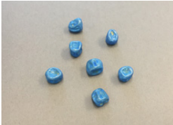
スナップエンドウの種