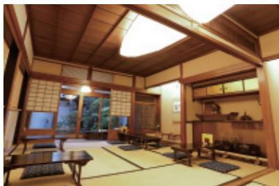
由緒ある古美術品が配された趣ある和室

地元の方から観光客まで、とにかくお客様が途切れることのない人気店。茶寮はそんなお客様とのふれあいの場にもなっていて、スタッフの方もとてもフレンドリー。本店に来たらずい茶寮にも立ち寄ってみてね。