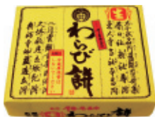
黄色いパッケージでお馴染みの生わらび餅(¥648)。第21回全国菓子大博覧会で内閣総理大臣賞を受賞した銘菓。