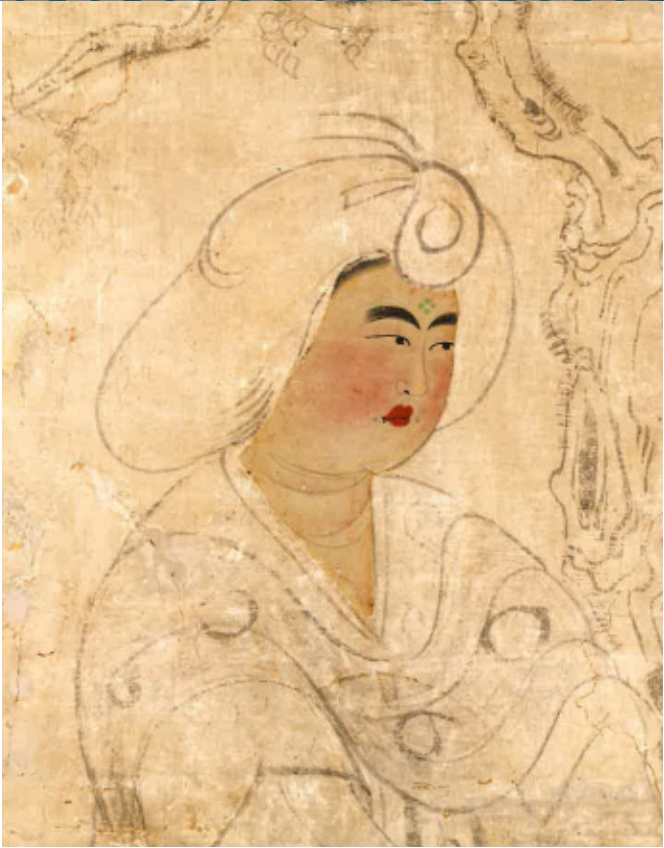
国家珍宝帳記載品、聖武天皇遺愛の品・鳥毛立女屏風 第4扇

宝物を献納した光明皇后は、時の権力者・藤原不比等の三女で、初めて皇室以外から皇后になった人物。権力闘争や天変地異など幾多の困難を乗り越え、聖武天皇と共に波瀾の時代を生き抜いた。