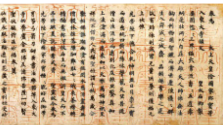
国家珍宝帳 正倉院宝物

光明皇后が聖武天皇の遺品六百数十点を献納した時の目録。巻首にかかげられた皇后の願文は美文として有名。