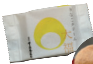
きなこクリーム大福 も大人気!(¥226)

千壽庵吉宗の看板商品でもある生わらび餅は、先代が古文書を紐解いて生み出したという銘菓。本わらび粉や甘藷でんぷん(共に鹿児島産)などの天然素材だけを用い、添加物を一切使用していないので冷やさず常温でいただくのが鉄則。まずはふるふるのわらび餅をそのまま口に載せて、柔らかな食感とほのかな甘みを味わってね。