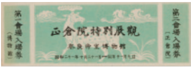
チケット・ポスター 右上/第1回正倉院展のチケット。第1回と表示されていないのは開催が1回限りの予定だったため。左/第2回正倉院展のポスター