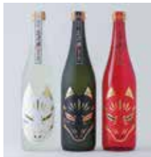
▲津和野太鼓谷稲成神社に 因んだ日本酒「毘津禰」(きつね) 清酒華泉(カセン)華泉酒造合資会社

当金庫は、島根県信用保証協会、津和野商工会と連携して、地方創生に繋がるお取引先の新商品開発を支援いたしました。