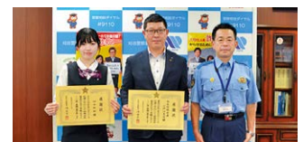
R5.07.27 小垣江支店 特殊詐欺未然防止功労