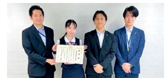
SNS型投資詐欺被害未然防止功労 成岩支店 半田警察署から感謝状受領