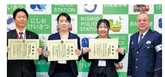
R6.03.01 中央支店 特殊詐欺未然防止功労