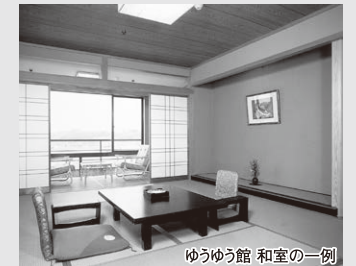
ゆゆう館 和室の一例

男性は大きく豪華な5つの湯、女性はバラエティ豊かな7つの湯がある源泉大浴露天風呂「千のこぼれ湯」はJTB宿泊アンケートでも高い評価です。旬の素材や、コシヒカリをはじめ、みそ・しょうゆまで福井県産の食材にこだわったお食事もうっとりとお楽しみください。