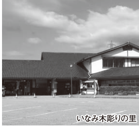
いなみ木彫りの里