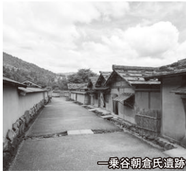
一乗谷朝倉氏遺跡