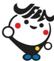
日弁連広報キャラクター ジャフバくん