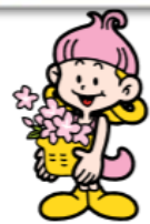
森の妖精/サッキー

●豊かな街づくりをお手伝いする● 西兵庫信用金庫 https://www.shinkin.co.jp/nisisin/