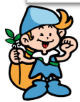
森の妖精/ネーチャ