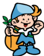
森の妖精/ネーチャ