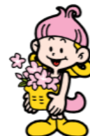
森の妖精/サッキー