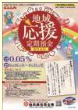
地域応援定期預金のパンフレット

新型コロナウイルスの影響により疲弊する地域の支援のために、地域応援定期預金の預入額に応じて、地域の自治体に寄付を行う「地域応援定期預金」を募集しました。