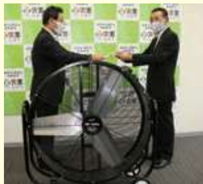
大型扇風機購入費寄贈

宍粟市内小中学校への支援の一環として、コロナ感染防止のために体育館用の大型扇風機の購入費を寄付いたしました。