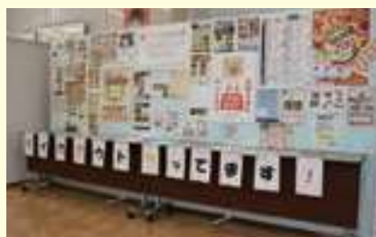
飲食店のテイクアウトを応援

コロナ禍の影響を受けた飲食店等に対して宍粟市で行われた「テイクアウト等応援事業」へ消費者アンケートやチラシ作成支援を行いました。