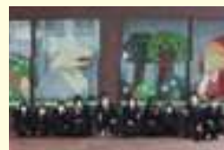
令和3年3月龍野北高等学校

地域のにぎわいづくりのために、本店北側ショーウィンドウを活用して、山崎高等学校と龍野北高等学校の生徒の皆さんによって展示していただいております。