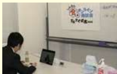
オンライン商談会「まんぷく兵庫」商談中の風景