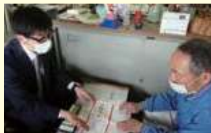
アンケート結果を取引先に説明

中兵庫信用金庫と当金庫で、コロナ禍の影響を受けた取引先を支援するために共同支援事業を実施しました。両金庫の役職員が消費者となり、それぞれの金庫の取引先商品を相互に購入しました。加えて、今後の商品開発や販売プロモーションなどに活かしていただけることを期待して、両金庫役職員によるアンケートを実施し、その結果を取引先に還元しました。