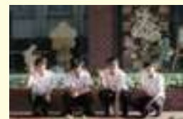
令和2年7月山崎高等学校