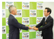
宍粟市内幼稚園等への図書カード贈呈