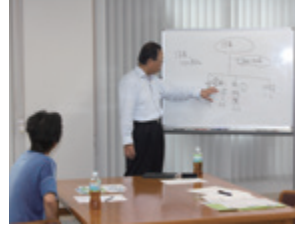
事業承継 個別相談会の風景