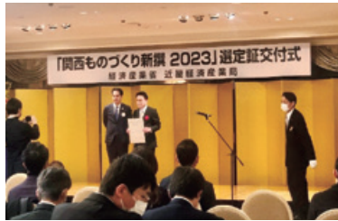
関西ものづくり新撰2023 選定証交付式

「関西ものづくり新撰2023」に当金庫が推薦機関となり応募した「フジ鋼業株式会社」様が選定されました。