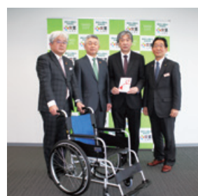
車椅子贈呈式(公立宍粟総合病院)

お預かりした定期預金の利息額の1/2相当分を当金庫が負担し、営業エリア内の公立病院等へ車椅子を寄贈する取組みを行いました。