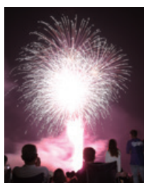
第35回山崎納涼夏祭り

当金庫本店所在地である山崎町の夏の風物詩となっており、今回は約1,300発の花火が打ち上げられました。