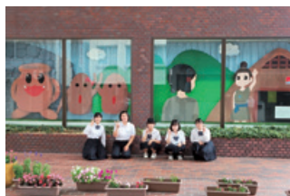
令和4年6月龍野北高等学校

地域のにぎわいづくりのために、本店北側ショーウィンドウを活用して、山崎高等学校と龍野北高等学校の生徒の皆さんにより展示していただいております。