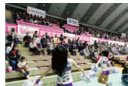
ヴィクトリーナ姫路 試合応援の様子

「ヴィクトリーナ姫路」はバレーボールVリーグに所属する姫路市のプロバレーボールチームです。令和4年度のリーグ戦は33試合開催されました。