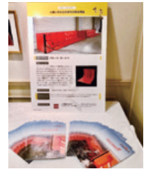
フロード・ガード （フジ鋼業株式会社）