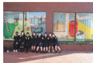
令和5年3月龍野北高等学校