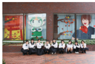
令和4年9月龍野北高等学校