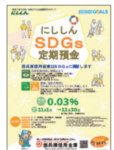
SDGs定期預金の パンフレット