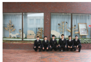
令和4年12月山崎高等学校