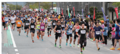
第15回宍粟市さつきマラソン大会

令和4年4月17日に「第15回宍粟市さつきマラソン大会」が開催され、距離や年齢、男女ごとに設けた計11部門に423名のランナーが参加しました。