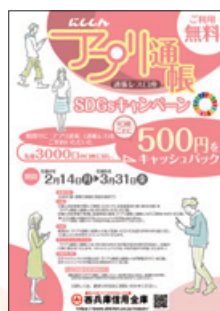
アプリ通帳SDGsキャン ペーンのパンフレット

紙通帳からアプリ通帳への切替で、お客さまの利便性向上とともに紙資源削減による環境保全、地域のお客さまのSDGsへの関心向上に繋がります。