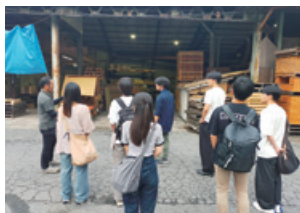
大学生による取引先企業のSDGs取組みの視察（2025年9月）