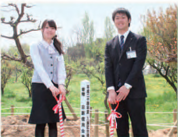
明石市石ヶ谷公園

平成12年に25周年を記念して始めました。以来毎年3カ所でする新入職員による記念植樹を行っております。