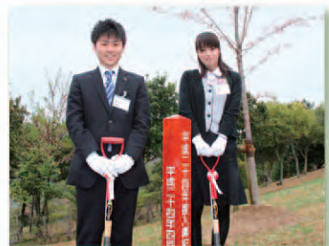
三木ホースランドパーク