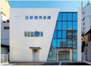
平成23年5月16日 明石駅前支店 新築移転オープン