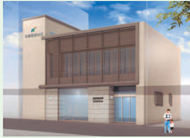
平成25年1月 宇治川支店 建替え新築オープン予定