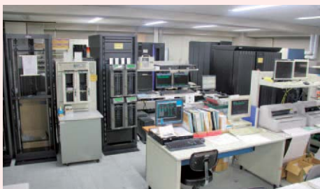
システム部内電算室

また、「システムリスク管理規程」では重大な事故が発生した場合について、「緊急時対応計画(コンテンツンジェンシープラン)」ではホストコンピューターが不測の障害により機能しないことが判明した場合について、「内国為替障害発生時の初期対応マ