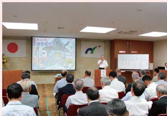
通常総代会(平成27年6月17日)