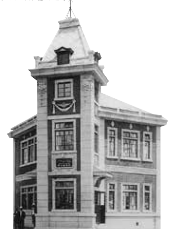
昭和 2 年～昭和 36 年までの店舗