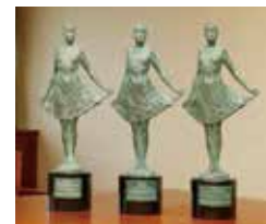
平成 11 年、25 年、28 年信用金庫社会貢献賞・各賞受賞