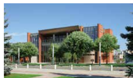
平成 21 年帯広駅周辺 4 店舗を統合し中央支店オープン