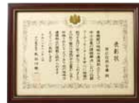
平成 20 年地域力連携拠点事業「中小企業庁長官賞」受賞