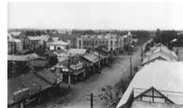
大正末期の店舗周辺 7 丁目から西を望む