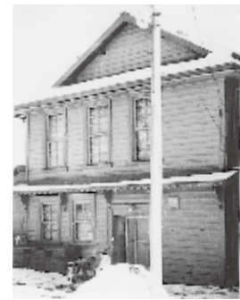
帯広信用組合設立準備室となった高倉宅 (商店の裏手) 大正 5 年