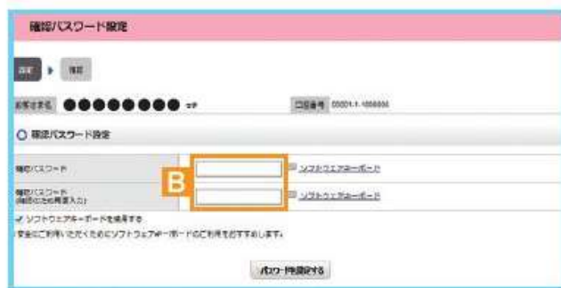
図 1-4：確認パスワード設定画面