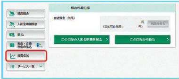
図 1-3：インターネットバンキングホーム画面