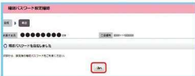
図 1-5：確認パスワード設定確認画面