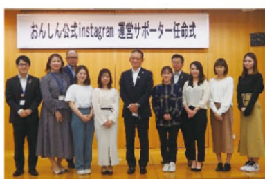
おんしん公式Instagram運営サポーター

また、12月には「おんしん公式Instagram」を開設しました。おんしんの職員がお客様を定期的に訪問し、お客様の魅力をどんどんInstagramで発信していきますのでご期待ください。QRコードから簡単にアクセスできます。お得なキャンペーン情報等も発信していきますので、是非一度は覗いてみてください。