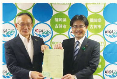
LGBTに関する古賀市との連携

フードドライブとは、家庭で使いきれない食べ物を持ち寄り、それらをまとめて福祉団体や施設等に寄付する活動です。