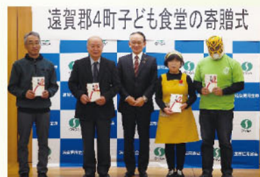
子ども食堂支援食品寄贈

地域支援活動でも、九州産業大学との「 包括的地域連携協定 」の締結、2回目となる「 福岡県新型コロナウイルス医療従事者応援金 」への寄付、北部九州の13信金合同で企業と企業の橋渡しを行う「 第6回しんきん合同商談会 」の開催など積極的に取り組んでおります。