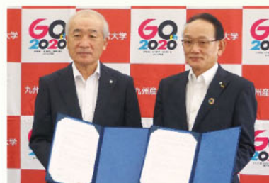
九州産業大学との包括的地域連携協定

地域支援活動でも、九州産業大学との「 包括的地域連携協定 」の締結、2回目となる「 福岡県新型コロナウイルス医療従事者応援金 」への寄付、北部九州の13信金合同で企業と企業の橋渡しを行う「 第6回しんきん合同商談会 」の開催など積極的に取り組んでおります。