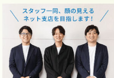
おんしんネット支店メンバー