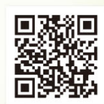
ネット支店はこちらから

また、12月には「おんしん公式Instagram」を開設しました。おんしんの職員がお客様を定期的に訪問し、お客様の魅力をどんどんInstagramで発信していきますのでご期待ください。QRコードから簡単にアクセスできます。お得なキャンペーン情報等も発信していきますので、是非一度は覗いてみてください。