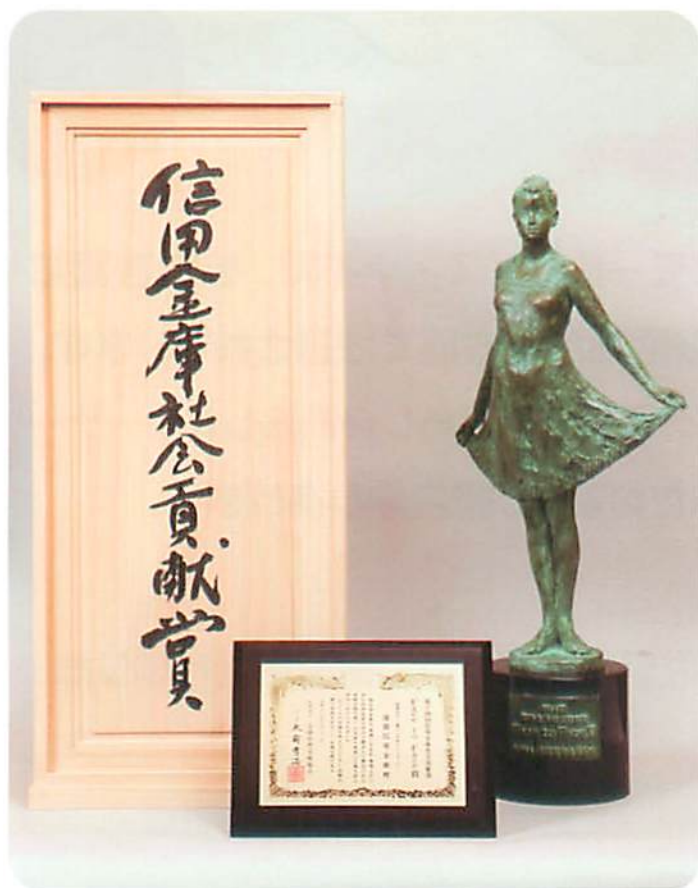
記念のブロンズ像と盾

全店舗に設けたコーナーでは、金融相談ばかりでなく、電球の付け替えや迷子犬の相談にまで関わっているというから驚きである。取引の有無に関係なく無料で応じ、場合によっては弁護士や専門家に相談して対応している。各方面から注目され話題になっていることから、これまた地域の頼りになる金庫として、業績アップにもつながっているはずである。