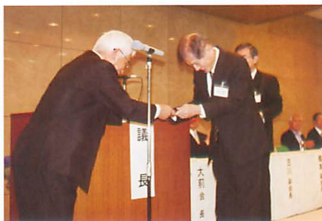
全国信用金庫協会大前会長から表彰状をいただきました。