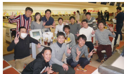
ボウリング大会風景