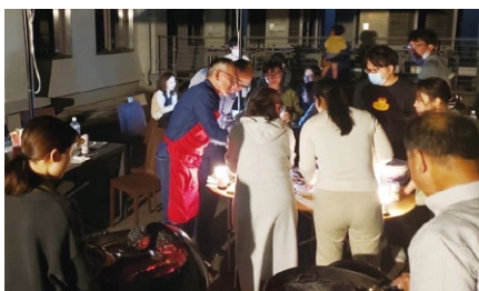
バーベキュー風景

働き甲斐のある職場環境づくりの一環として、職員間のコミュニケーション活発化を目的に、本部敷地内で不定期にバーベキュー会を開催しています。職員がいつでも利用できるよう、道具や設備は金庫で取り揃えています。