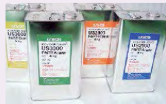
【各種コーティング剤】

デザイン工学科の先生を紹介していただきました。現在、大学の先生から輾圧機の最適化をおこなうべく様々な助言をいただいております。大学の先生を紹介してもらい、弊社としては身近に技術相談ができる場所が増えて、心強く感じています。今後もお客様や公的支援機関様など、多くの方々のご意見とご理解、ご支援をいただきながら、コーティング業界に革新を起こしていきたいです。