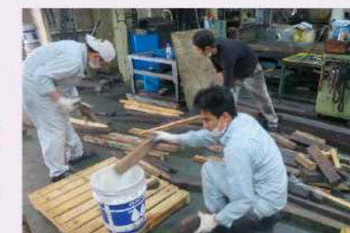
【現場カイゼンの様子】

今後、モノづくり現場に潜むムダを一つでも多く発見し、カイゼン案を検討、実施することによって、これまで以上のサービス提供に努めてまいります。