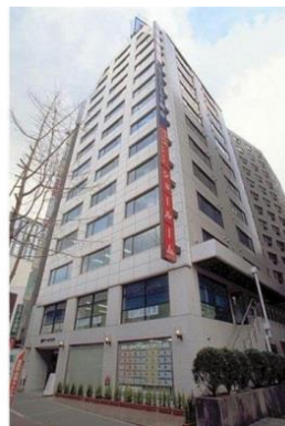
近畿事務所入居ビル