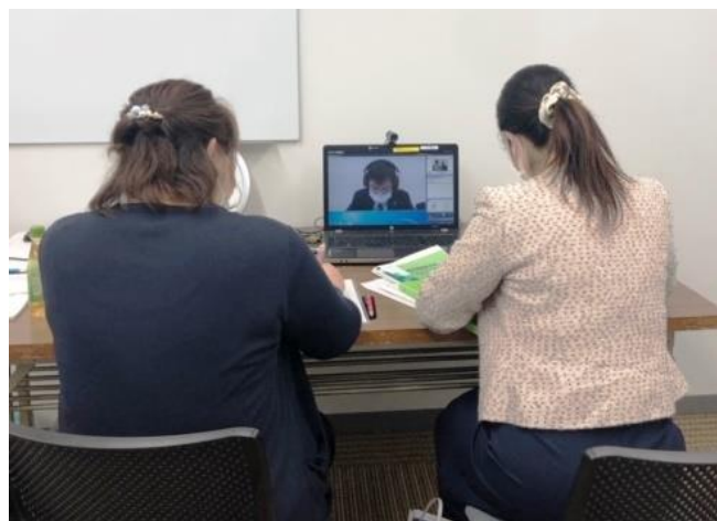
《支店での相談風景》