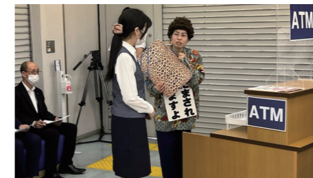
住吉警察署との防犯訓練 (住吉支店)

ほかにも、警察署との防犯訓練を定期的実施し、職員の特殊詐欺への対応力強化に努めています。お客さまの大切なご預金を守るため、必要に応じてお声がけや警察へ臨場を依頼する場合がありますので、ご協力をお願いいたします。