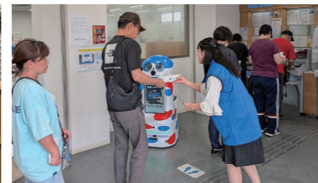
平野警察署との周知活動 (平野支店)