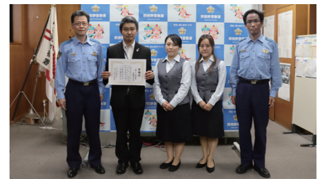
特殊詐欺未然防止で阿倍野警察署長から表彰 (阿倍野支店)