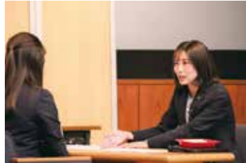
テーマに沿ってロールプレイングを行う演技者

だ案件を基に演技を披露。約300名の役職員が熱心に見学し、応酬話法などを学びました。