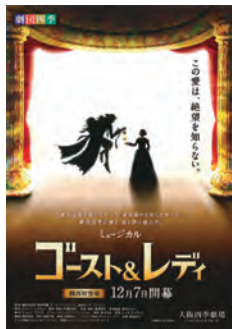
上演した劇団四季ミュージカル「ゴースト&レディ」

いで完売した劇団四季ミュージカル「ゴースト&レディ」を観劇。信念を貫くナイチンゲールと劇場のゴーストグレイの永遠の絆の物語に参加者からは感動の声が続々と上がりました。