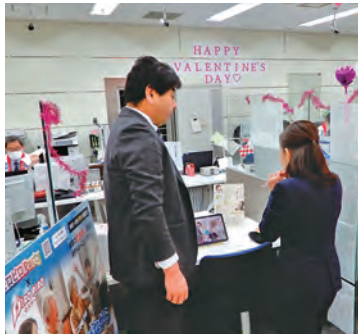
ピロピロpartyの体験コーナー（森ノ宮支店）