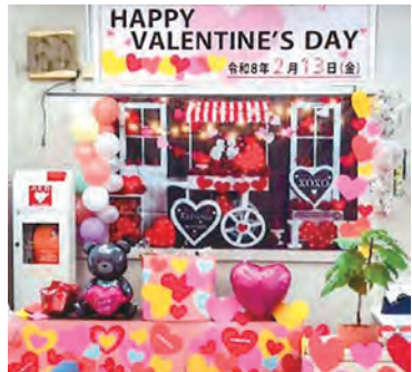
バレンタイン仕様に飾り付けられた店内（北山本出張所）

2月13日、各営業店でお客さまへの日ごろの感謝の気持ちを込めバレンタインなどのイベントを開催しました。