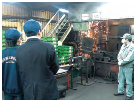
お取引先の工場を見学する生徒（住道支店）

当日、生徒たちは金融機関の役割や業務内容を学んだあと、お客さまの迎ええやあいさつ、紙幣の数え方（札勘）の体験など、さまざまなカリキュラムに臨みました。