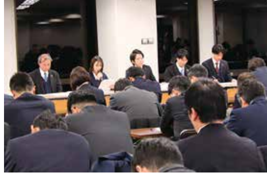
プロジェクトチームによる発表

1月22日、当金庫本店で第8期課題解決型融資プロジェクトチームの発表会を開催しました。このプロジェクトは、課題解決の知見を蓄積することを目的として、2018年度から毎年開催しています。今年度も職員が6つのチームに分かれ、約半年間にわたって検討した課題解決策をお取引先企業へ提案しました。発表会ではメンバーから提案内容の検討プロセスの説明があり、聴講した役職員と活発な意見交換が行われました。