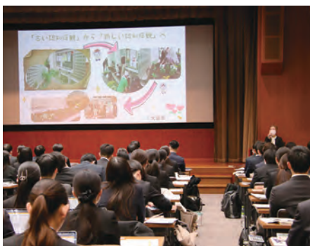
認知症の方への理解を深める新入職員

1月20日、本店2階大ホールで「認知症サポーター養成講座」を開催し、新入職員122名が受講しました。