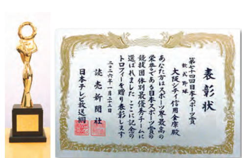
日本スポーツ賞で拝受したトロフィーと表彰状

野球部が「第74回日本スポーツ賞」の「競技団体別最優秀賞」を受賞し、1月22日に東京都港区のオークラ東京で表彰式が行われました。同賞受賞は2021年以来5度目となります。 日本スポーツ賞は、日本スポーツ界の発展と向上のため1951年に制定され、その年に最も活躍した選手やチームに贈る名誉ある賞です。野球部は、昨年開催された「天皇賜杯第80回全日本軟式野球大会」での4年ぶり5度目の優勝を高く評価されての受賞となりました。