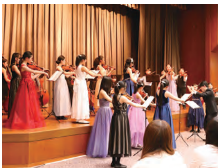
すばらしい演奏を披露する相愛ジュニアオーケストラ

当金庫は1月16日、地域の音楽イベント「2026 船場 New Year's Concert」に本店2階大ホールを公演会場として提供しました。