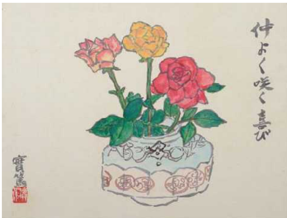
「薔薇」 武者小路 実篤