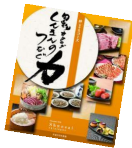
【特別賞】旬彩カタログギフト 『しんぎんのつなぐ力 絆コース』