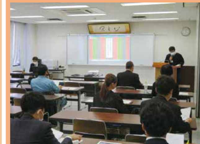
事業承継セミナーの開催