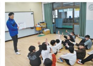
お金×フットサル教室