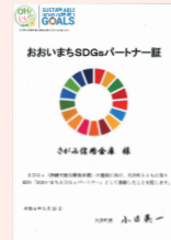
おおいまちSDGsパートナー