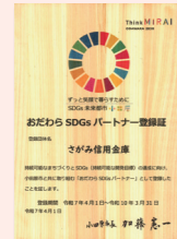
おだわらSDGsパートナー