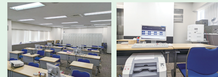
研修専用施設 キャリアセンター

また、キャリアセンターには、実際の営業店にあるものと同じ端末機器が設置されているため、より実務に則した業務研修を実施することができます。