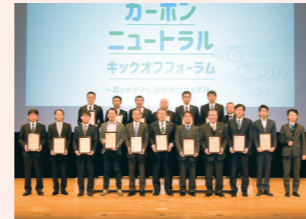
南足柄市カーボンニュートラル・パートナーシップ協定