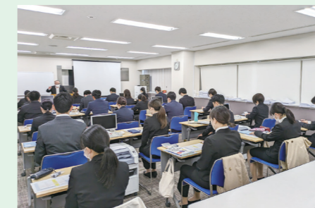
キャリアセンターでの新入職員研修の様子

配属後も定期的なフォローアップ研修を行うことで、自身の成長を実感しながら次のステップへと着実に繋げていくことができます。