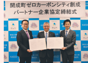
開成町ゼロカーボンシティ創成パートナー企業協定