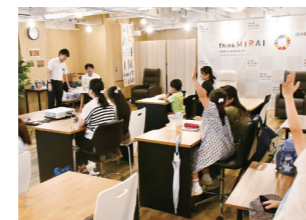
みんなでSDGsを学ぼう!

さがみ信用金庫は、これからも引き続き、地域の未来を担う子どもたちのために「学び」の場を提供していきます。