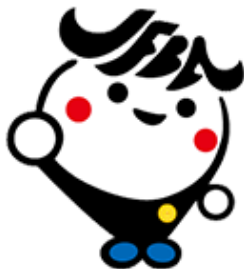
日弁連広報キャラクター ジャフバ