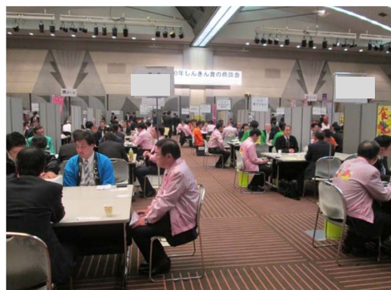
個別商談のイメージ