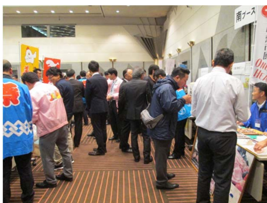
フリー商談のイメージ

上記は、10商談行われる場合のタイムスケジュールの例です。 実際の商談数、タイムスケジュール等は、各事業者様で異なります。（9月下旬までに決定予定）