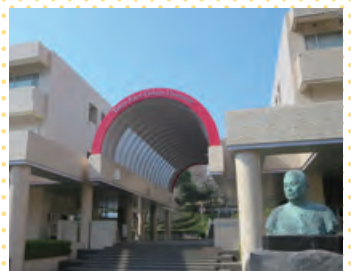
東京家政学院大学