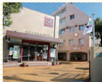
東京栄養食糧専門学校／ 東京調理製菓専門学校