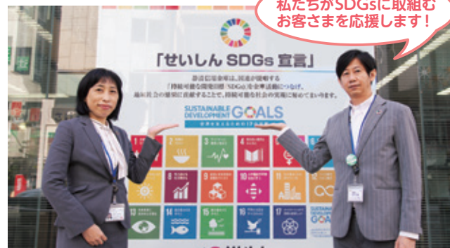
地域創生SDGs推進課職員

SDGsに関する情報提供、SDGs宣言書の作成支援、勉強会やセミナーへの出講など、SDGsの取組みに係るご相談にお応えしております。