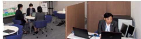
相談センター「kyoten」の様子

小規模セミナーの定期開催も予定しております。皆さまのご参加をお待ちしております。